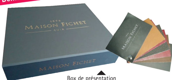
Box de présentation